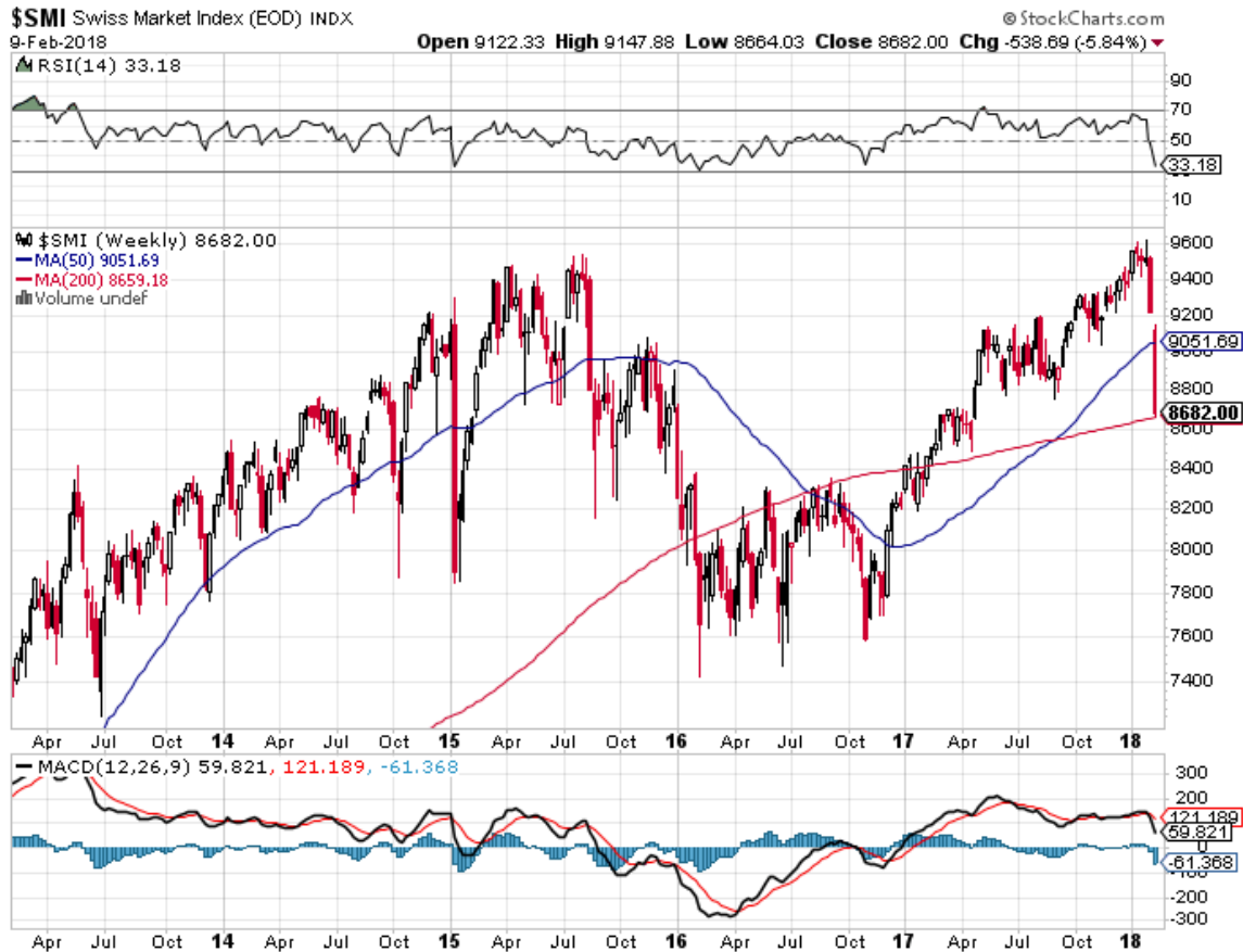
Etude du SMI (Swiss Market Index) : Hebdomadaire – 8682 points.

Sur une base journalière, on distingue parfaitement le GAP de cotation à 8580, comme prochain objectif de la baisse avant un violent mouvement de reprise à la hausse. L'objectif de la reprise se situe dans la zone de 9100 – 9200 points. En cas de poursuite du mouvement de baisse le prochain support se situe dans la zone de 8400 points.